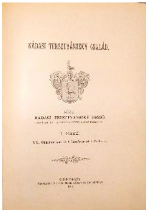
A könyv borítója

Írásai jelentek meg a következő lapokban: Pesti Napló, Eger, Népiskolai Tanügy, Népiskola és a Turul. Munkája: Nádas Tersztyánszky család. I. rész. 20 okmánnyal és 6 leszármazási táblával. Nyíregyháza, 1901. 29