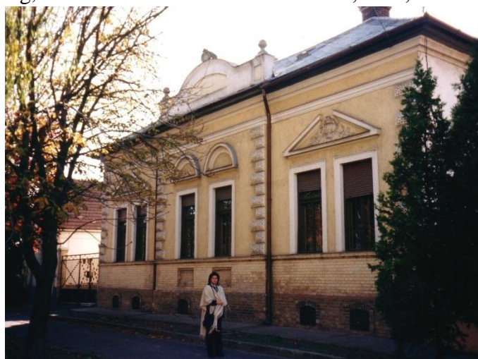
A Sárközy-féle szülői ház

De ez mind már az apai házban zajlott, az akkori Alkotmány utca 7.-ben (ma Szent Imre herceg út), amiről a Berényi polgárházak belső világa című írásomban (Jászsági Évkönyv, 2005.) már egyszer megemlékeztem.