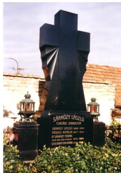
Nyughelye a Szent Imre-temetőben

Elhunyt: 1974. március 28-án. Sírja a jászberényi Szent Imre-temetőben található.