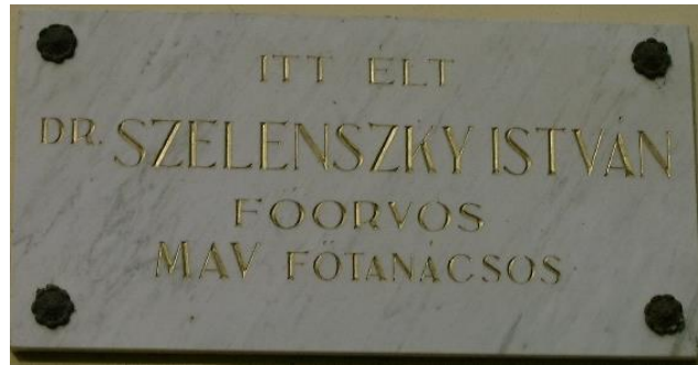
Emléktábla a lakóházán