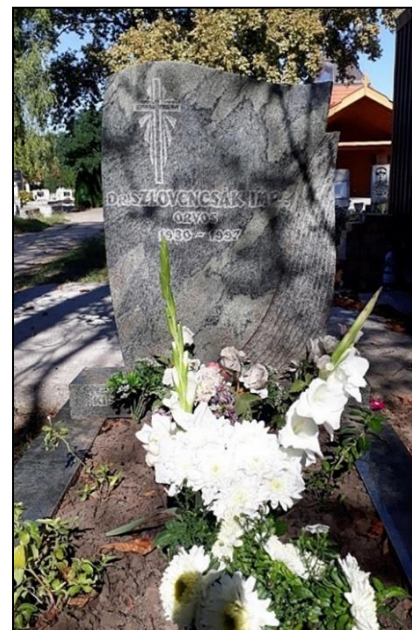
Sírja a jászapáti temetőben