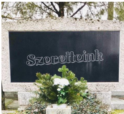
Nyughelye a Fehértói temetőben

A budapesti fogászati klinikán volt gyakornok.