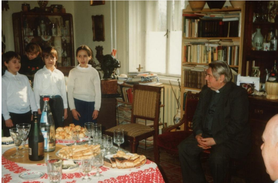
Mátyás-napkor a katolikus iskolások köszöntik

„Farkas Mátyás nem sokat mutatkozott a fáradozása eredményeként létrejött katolikus iskolában, inkább csak az iskolaszék ülésein és az ünnepein vett részt, de az iskola működését figyelemmel kísérte, és a jó kezdeményezéseket szavaival, bátorításával és anyagilag is támogatta.” 14