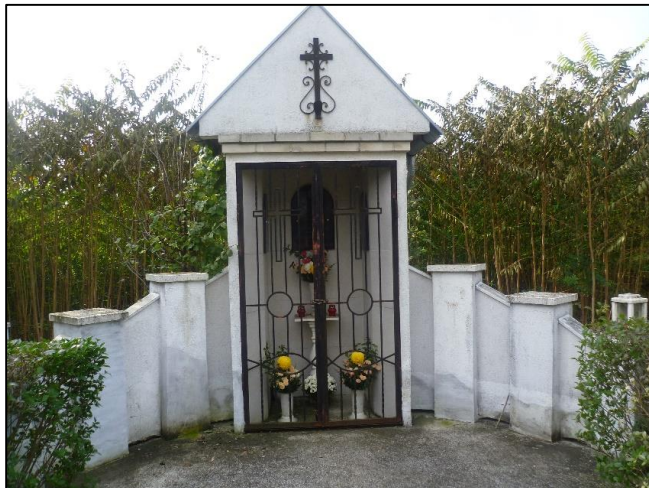
Síremléke a törökszentmiklósi temetőben

„Békén nyugodjál csendes hűs sírodban, Bár munka vár még itt e földi honban, Pályád bevégezd, célodat elérted, Ég lesz a béred.” 22