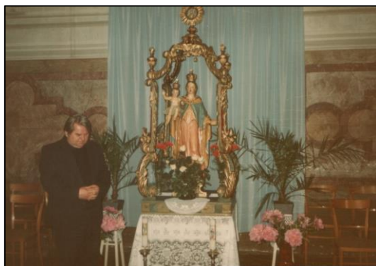
Prágai Mária-szobor mellett

1990 tavaszán elindította a templom teljes külső felújítását, beleértve a kereszt és a korona aranyozását. A toronysisak hibáinak rézlemez-pótlásokkal való kijavítását, a torony kódíszének tisztítását és impregnálását, az ereszcatorna rézre cserélését, a nyaktag-rész rézlemezzel történő borítását és az ablakkeretek külső mázolását is. A támogatások, pályázatok egységes, elkülönített kezelésére 1994-ben létrehozta a Templomfelújítást Támogató Alapítványt. Nagy horderejű tervéből – az 1995-ös Jász Világtalálkozó idejére – elkészült a torony és a hozzá csatlakozó főhomlokzati szakasz.