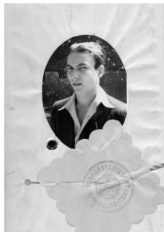
Egyetemi index fotója