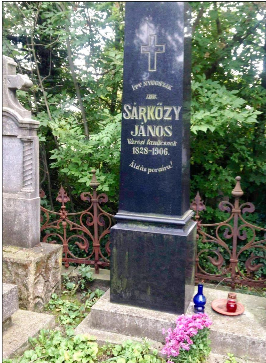
A Sárközy-kripta a jászberényi Újtemetőben

2016. január 24-én hunyt el Budapesten. Nyughelye a jászberényi Újtemetőben a Sárközy-kriptában van.