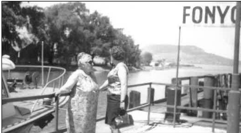
A Balatonnál a felesége és az unokahúga