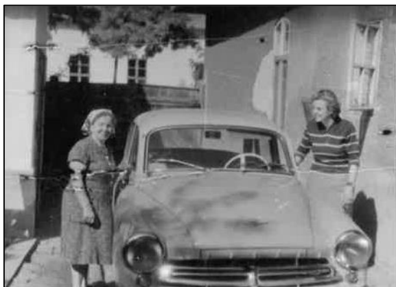
Az autó mint munkaeszköz