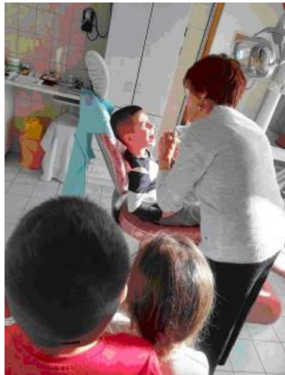
A felvételek 2019 novemberében készültek