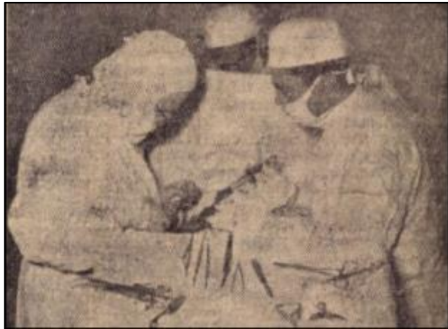
A 60 éves doktornő műtés közben

1952-től a Jászberényi Városi Kórházhoz került, ahol sebészfőorvosi kinevezést kapott és ahol nyugdíjazásáig dolgozott.