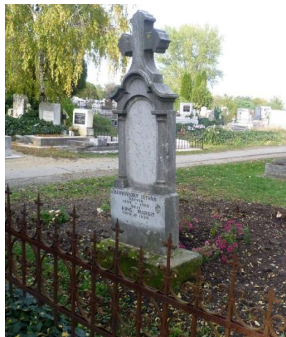
A Benyovszky család síremléke

Jászberényben a Fehértói temetőben szülei és nővérei mellé helyezték végső nyugalomra. 8