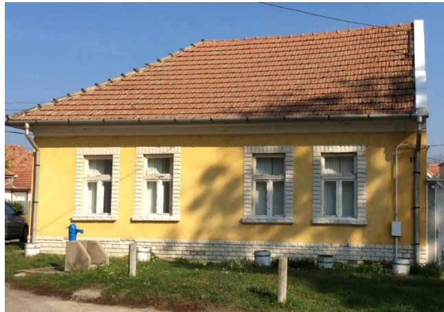
Az egykori Benyovszky-ház

A II. világháború után, 1948-ban, az OKH-t feloszlatták, és őt nyugdíjazták. Néhány év kihagyás után ismét dolgozni kezdett Jászberényben, az ügyvédi munkaközösségben.