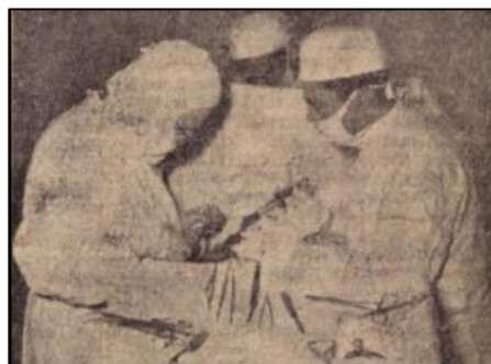
A 60 éves doktornő műtés közben

Kiváló orvos kitüntetését követően a Szolnok-megyei Néplapban írták róla: „Ő a legnépszerűbb orvos a jászsági »ispotályban«. Szinte minden pillanatát a kórházban tölti, ott is lakik, s még éjjelenként is felkel és sorra látogatja a betegeit.”