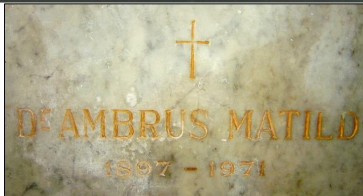
Nyughelye a jászberényi Nagyboldogasszony Főtemplom kriptájában